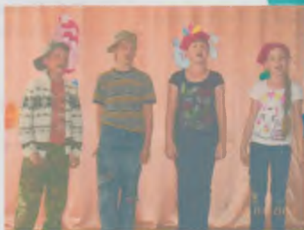
В художественной мастерской