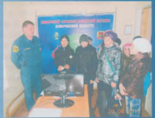
Ребята 5а класса на экскурсии в пожарной части