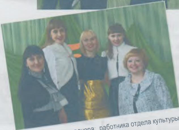
Гости вечера: работница отдела культуры