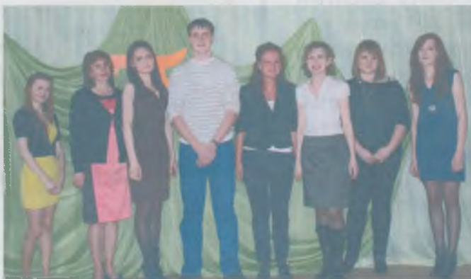
Бывшие выпускники-медалисты школы

Что такое юбилей? Много шариков, гостей! Юбилей у нашей школы – Самый главный юбилей! Дарят все цветы, подарки, Вспоминают, как за партой Получали знания И в любви признания. Ей уже семьдесят пять, Мне – всего лишь девять, Ну, никак я не могу В это всё поверить! Двадцать, тридцать лет назад Здесь учились дети. Дети нашей первой школы – Лучшие на свете! Кто живёт на севере, Кто живёт на юге, У кого-то дети, У кого-то внуки. Тот – учитель, Этот – врач, Кто-то повар, Кто-то ткач. Встретились с друзьями снова, Словно много лет назад. Наша школа вновь готова Повстречать своих ребят.