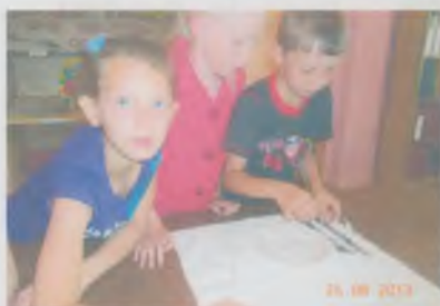
В районной библиотеке